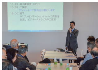
荻野社長のご挨拶