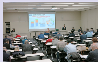
日本証券アナリスト協会 個人投資家向け会社説明会 (日経茅場町別館カンファレンスルーム)

日本光電へのご理解をより一層深めていただけるよう、定期的に個人投資家向け会社説明会を開催し、当社の強みや成長戦略、株主還元についてご説明しています。第75期は、対面、オンライン形式で計3回開催、延べ約5,300名の方々にご参加・ご視聴をいただきました。今後も個人株主・投資家の皆様との対話機会を増やすため、様々な開催形式・時間帯で、継続的に会社説明会を開催します。