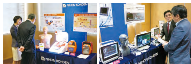
株主総会製品展示

また、日本光電の医療機器の展示を行い、株主様に製品の特長などをご説明しています。2019年6月開催の株主総会では、新製品の全自動血球計数・免疫反応測定装置や中位機種ベッドサイドモニター、一般家庭向けAED、当社初の自社製人工呼吸器、医療機器リモート監視システムをご紹介します。