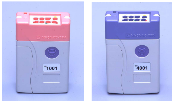
ZB-910P(ピンク) ZB-920P(紫) ZB-910PとZB-920Pは同形状です。機種により、コネクタ接続部の色が異なります。

また、専用の2リードタイプの電極リード線を使用することにより、不閉電極を使用しない2電極での測定も可能です。